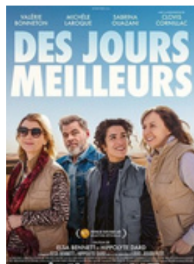
DES JOURS MEILLEURS