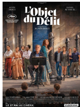
L'OBJET DU DÉLIT