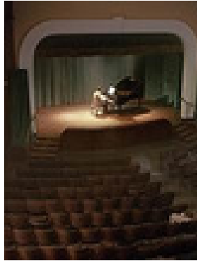
NOTRE HISTOIRE CHRONIQUE DU CAIRE