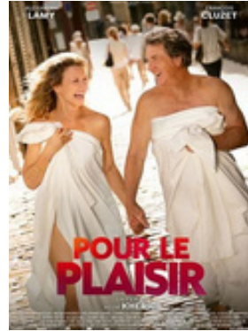
POUR LE PLAISIR