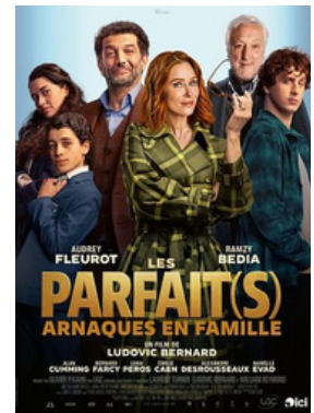
LES PARFAITS ARNAQUES EN FAMILLE