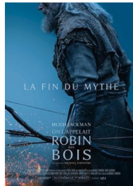
ON L'APPELAIT ROBIN DES BOIS